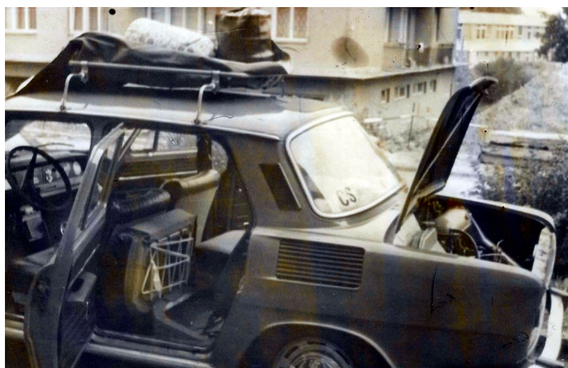
To není celní kontrola, jen klasická příprava na odjezd zelené příšery na dovolenou.